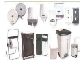
Listado de tarifas de venta