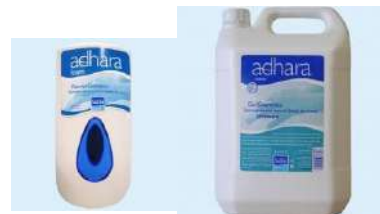
Listado de tarifas de venta