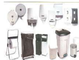
Listado de tarifas de venta