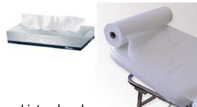
Listado de tarras de venta