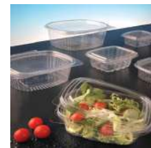
Listado de tarifas de venta