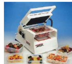
Listado de tarifas de venta