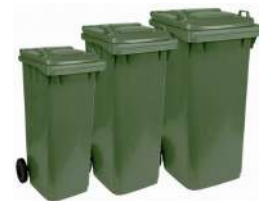
Listado de tarifas de venta