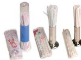
Listado de tarifas de venta