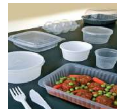
Listado de tarifas de venta