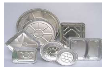
Listado de tarifas de venta